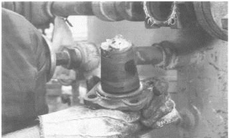
Вентили, защищенные устойчивой к химикатам смазкой для вентилях MOLYKOTE 3452 , не проявляют признаков коррозии или распада смазки.

Эти консистентные смазки работают в широком диапазоне температур. Устойчивая к химикатам смазка для подшипников MOLYKOTE 3451 имеет хороший срок службы при температурах от -40 до +232°C. Устойчивая к химикатам смазка для вентилях MOLYKOTE 3452 имеет диапазон рабочих температур от -29 до +232°C. Обе эти смазки устойчивы к повреждению вследствие воздействия на них растворителей, кислот, хлоридов и других сильных химикатов, а также пара низкого давления и конденсата. (См. Таблицу I.). Испытания на подшипниках показывают, что консистентная смазка MOLYKOTE 3451 имеет хороший срок службы при различных высоких нагрузках и скоростях.